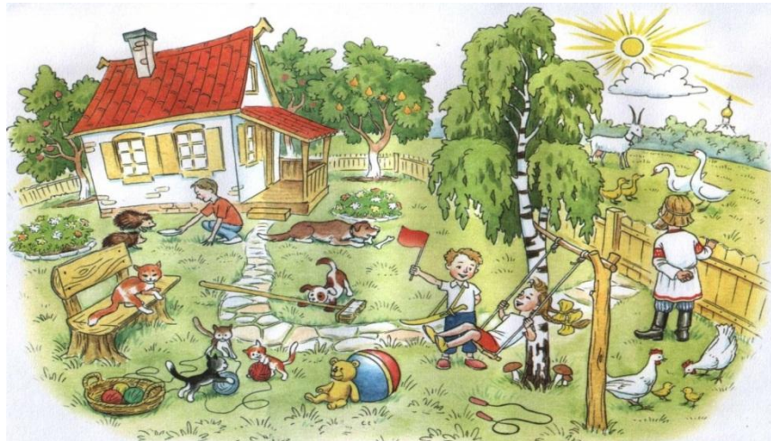
Игра "А что было дальше?»

Вместе с ребенком посмотрите в окно. Поиграйте в игру "Кто больше увидит". По очереди перечисляйте то , что видно из вашего окна. Описывайте все увиденное в деталях. Например: "Я вижу дом. Возле дома стоит дерево . Оно высокое и толстое, у него много веток, а на ветках листочки". Если ребенку трудно описать предмет, помогите ему наводящими вопросами. "Ты увидел дом? Он низкий или высокий?". Игра способствует развитию активной речи , наблюдательности, пополнению словарного запаса.